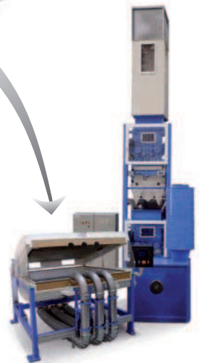
Llenado de piezas de tapicería Cushions Filling