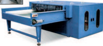
Reciclado de retales de acolchados Quilted Waste Recycling