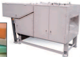
Reciclado de restos de espuma Foam Waste Recycling