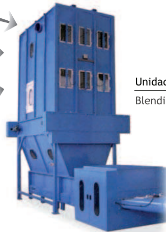
Unidad de mezcla Blending Unit